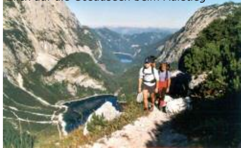
Blick auf die Gosauseen beim Aufstieg

Vom Hintere Gosauseesüdufer dann am Weg Nr. 614 rechts Richtung Adamekhütte auf den niederen Bärenstaffel hinauf. Auf 1550 m quert man auf einer kleinen Holzbrücke den Kreidenbach . Es handelt sich hier quasi um den Ablauf des Schmelzwassers aus höheren Gletscherregionen. Das Bachbett ist jedoch nur im Frühling bei der Schneeschmelze oder nach starken Regenfällen mit Wasser gefüllt, denn der so kompakt aussehende Dachsteinkalk ist voller Ritzen und Spalten, die den Wasserhaushalt der Region größtenteils unterirdisch passieren lassen. Bei 1638 m findet man unmittelbar neben dem Weg eine Tafel, die auf die bereits verfallene Grobgesteinhütte hinweist. Von dieser Tafel einige Meter nach links aufwärts zu gehen macht sich bezahlt, an einen riesigen Felsblock geschmiegt findet man die Überreste des ersten alpinen Bersteigerunterstandes auf dieser Seite des Dachsteins . Am " Hohen Riedl " auf 1809 m ist die größte Anstrengung geschafft . Von hier an legt sich der Weg zurück, man betritt das alte Gletscherbecken des Großen Gosaugletschers, nun ist die Umgebung nicht mehr von schroffen Felsformationen, sondern von Schuttmoränen und Gletscherschliffplatten bestimmt. Es ist auf jeden Fall ratsam bei der Adamekhütte eine Übernachtung einzuplanen, damit man dann am nächsten Tag mit frischen Kräften den Gipfel erstürmen kann.