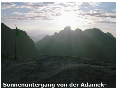
Sonnenuntergang von der Adamek-

Achtung: Ein hochalpiner Übergang der Trittsicherheit und sehr gute Kondition erfordert. Im Juni oft noch steile Schneefelder unterhalb des Hosskogels, bitte beim Hüttenwirt erkundigen und genug Trinkflüssigkeit mitnehmen.