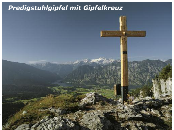
Predigstuhlgipfel mit Gipfelkreuz

Der Rückweg erfolgt am Weg Nr. 247 zurück zum Berghof Predigstuhl.